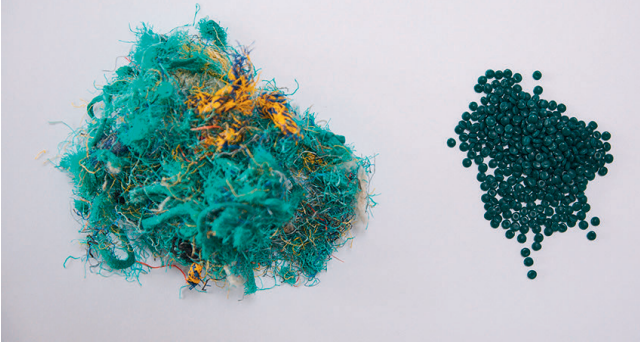
Bild 2. Durch mechanisches Recycling wird aus den maritimen Abfällen wieder hochwertiges Kunststoffgranulat