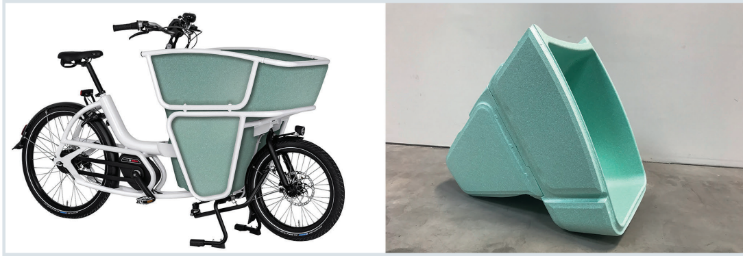
Bild 4. Machbarkeitsstudie für das Lastenrad Urban Arrow Shorty: Der Transportbehälter wurde komplett aus dem Partikelschaum Arpro 35 Ocean gefertigt