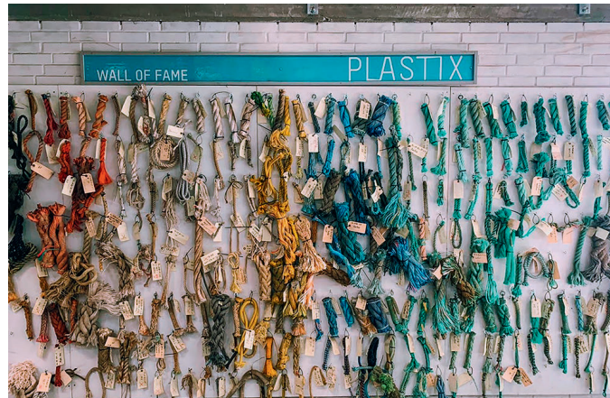
Bild 1. Über 900 verschiedene Arten von Netzen und Seilen sind in der Datenbank von Plastix gespeichert. Die „Wall of Fame“ des Unternehmens zeigt einen Auszug

Die verstärkte Konzentration auf eine funktionierende Abfallbewirtschaftung, EPR-Regelungen und eine strengere Gesetzgebung hat die Verfügbarkeit von verwertbaren Abfällen und Rezyklaten erheblich erhöht und zu verstärkten Kooperationen zwischen Recyclingunternehmen und Kunststoffherzeugern geführt. Eine solche besteht beispielsweise zwischen dem dänischen Recycler Plastix, Lemvig, und JSP International, Estrées-Saint-Denis/Frankreich. Plastix recycelt u.a. Fischer- und Schleppnetze und Seile, die sonst auf Deponien oder im Meer landen würden. »