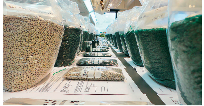
Bild 3. Vor der Auslieferung werden die Rezyklate analysiert und einer Qualitätskontrolle unterzogen

Das Unternehmen gehörte zu den ersten 13 Unternehmen weltweit, die am Beschleunigerprogramm der Vereinten Nationen für die Ziele der nachhaltigen Entwicklung teilnahmen.